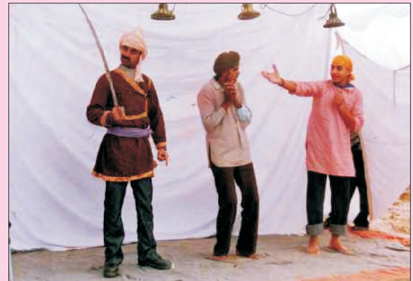
ਸਤਵਿੰਦਰ ਬੇਗੋਵਾਲੀਆ ਦੁਆਰਾ ਰਚਿਤ ਨਾਟਕ 'ਜੇਹਾ ਬੀਜੇ ਸੋ ਲੁਣੈ' ਦਾ ਇਕ ਦ੍ਰਿਸ਼