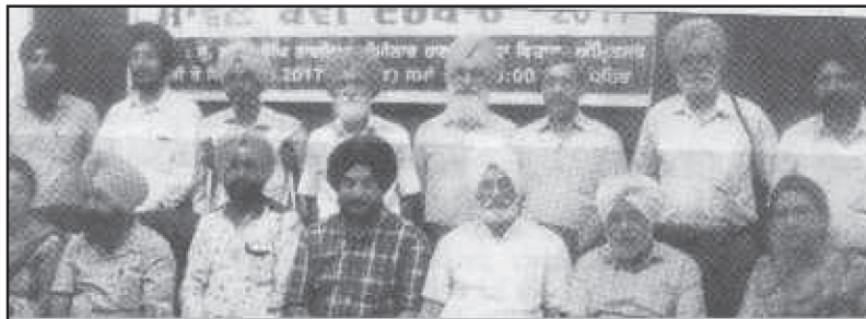
ਰੂਹ ਪੰਜਾਬ (59)

ਪੰਜਾਬੀ ਸਾਹਿਤ ਸੰਗਮ ਅਤੇ ਵਿਰਸਾ ਵਿਹਾਰ ਸੁਸਾਇਟੀ ਅੰਮ੍ਰਿਤਸਰ ਵੱਲੋਂ ਕੇਂਦਰੀ